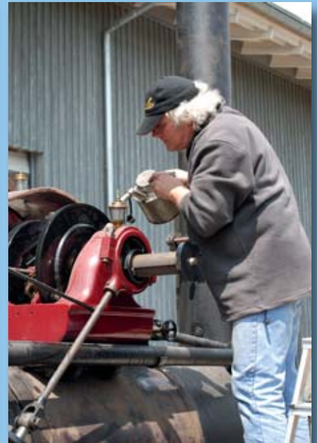
...und frisches Öl auffüllen.