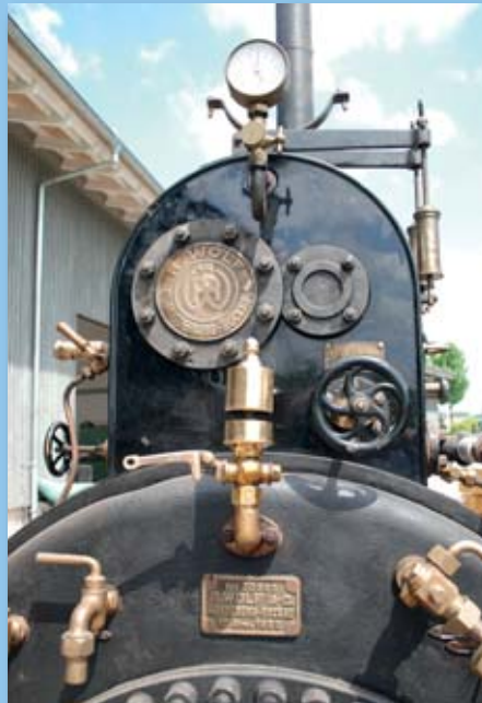
...Armaturen polieren und prüfen...