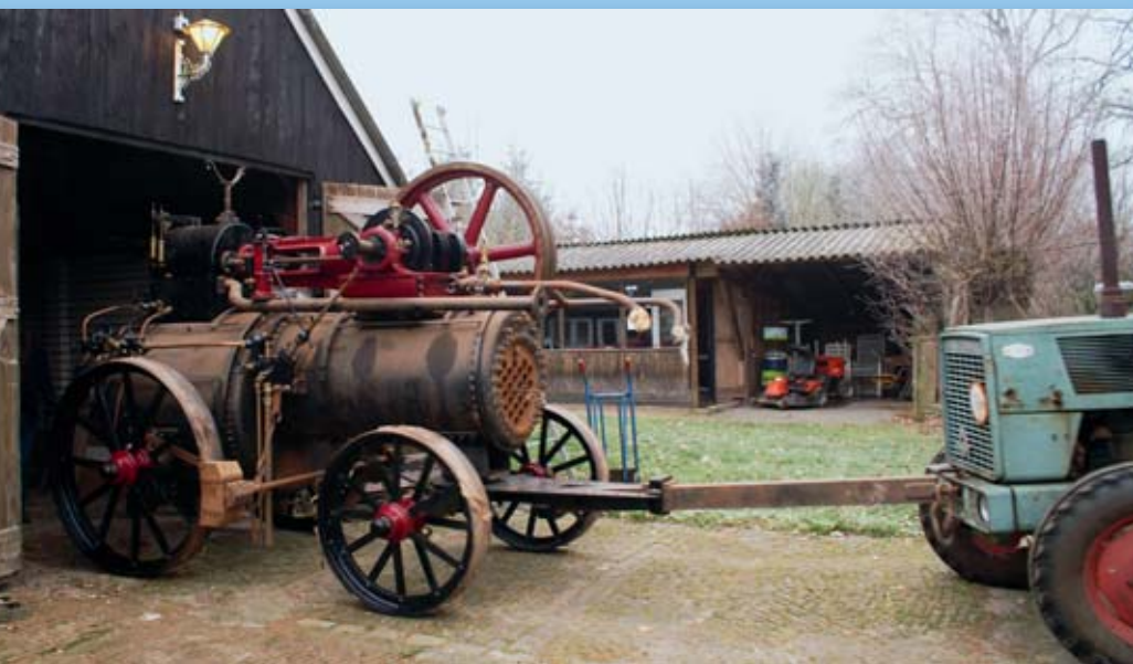
Rund 15 Jahre verbrachte die Lokomobile in einer niederländischen Scheune.