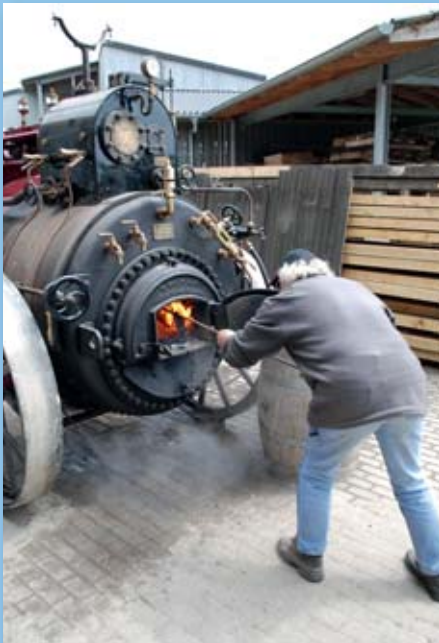
Spannung am TÜV-Termin: Anheizen...