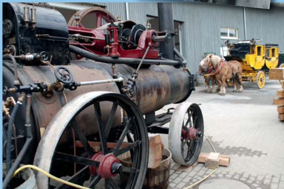
Begegnung vor der Museumswerkstatt: Lokomobil begrüßt Postkutsche.