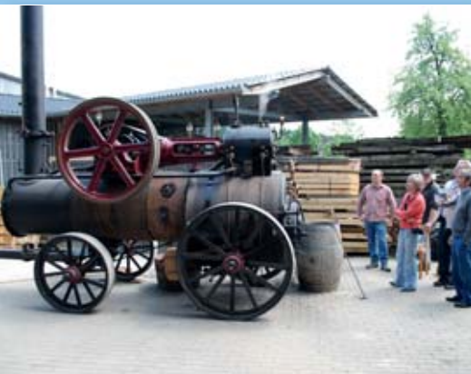
Na bitte, geht doch! Bei zehn Bar bläst das Überdruckventil unter kräftigem Zischen ab.